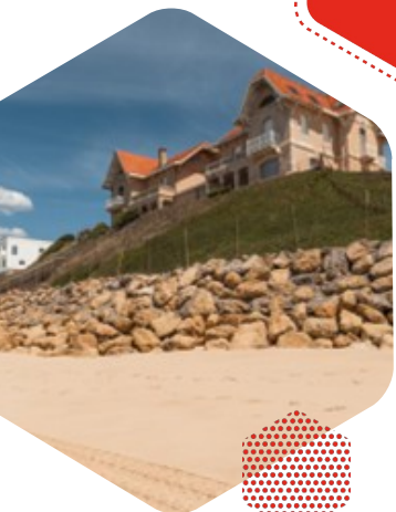
Les villas jumelles et le grand hôtel de la plage menacés par l'érosion

Opportunités de prêts, d'investissements et de consignations