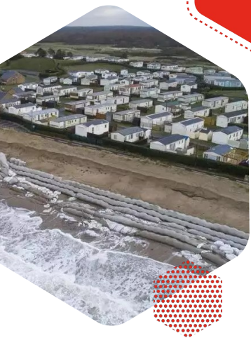
Campings de Gouville sur Mer menacés par l'érosion du trait de côte

En parallèle, mettre en œuvre la renaturation et la recomposition des interfaces terre-mer.