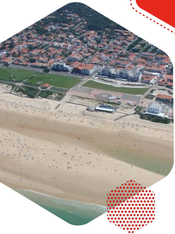
Vue aérienne du front de mer de Biscarosse-plage

Co-financement des études d'ingénierie pour définir la stratégie (10 000 € en 2022, 20%)